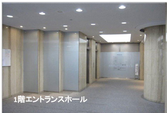
1階エントランスホール