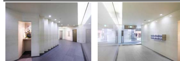
1階エントランスホール